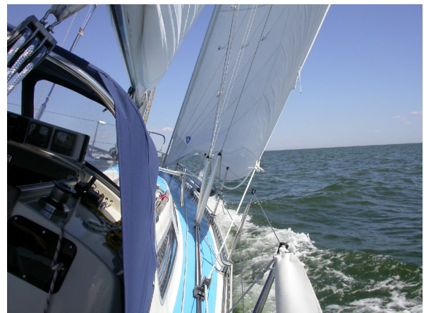
Är det inte så här vi vill uppleva seglingen, bilden är hämtad ur arkivet från vår segling till Lettland.