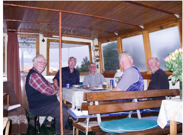
Styrelsen i möte ombord på M/S Bore