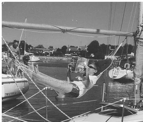
Jungman Hampus i viloläge

över Turmulefjärden och gick via Horvelsö ut på Aspöfjärden och förbi Arkö. Det har sin absoluta tjusning att segla med kunniga kamrater. I mitt fall hade jag nog annars gjort ett lite mer lättnavigerat vägval.